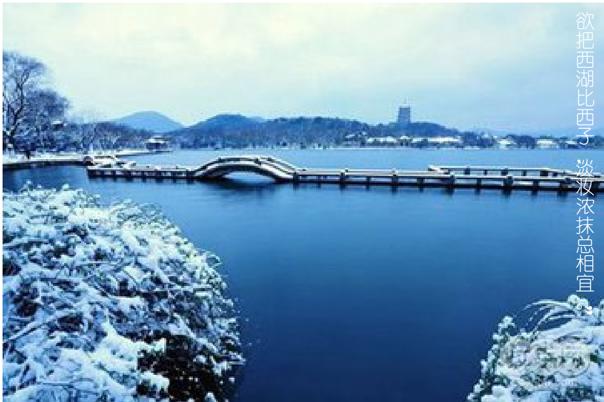
欲把西湖比西子，淡妆浓抹总相宜。

春天，岸边的柳树发芽了，向着湖面伸展着细嫩的枝条，在微风中轻轻摇动。西湖里的荷叶，长出嫩绿的叶片，像一枚枚浮在湖面上的钱币。仔细看去，还能看见湖里有一些小鱼儿，在叶子下面穿梭游玩，在湖面上缓缓地荡出涟漪。太阳照在湖面上，银光闪闪，美丽极了！